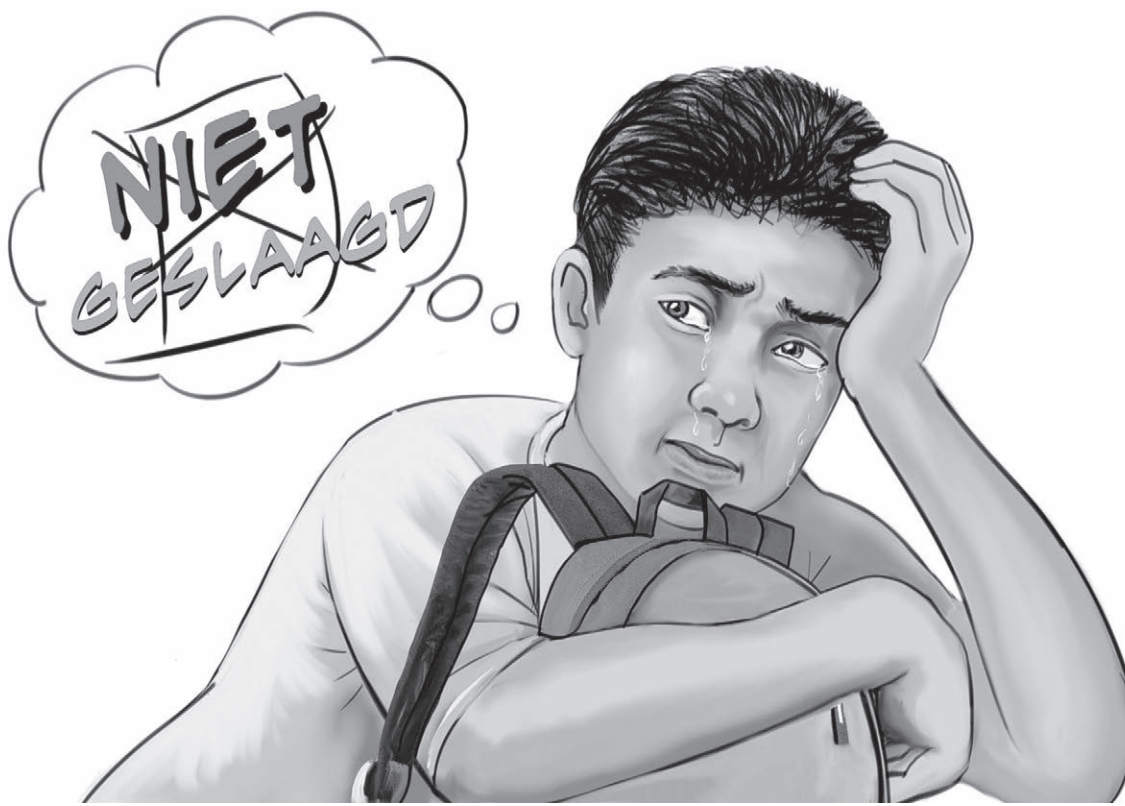
Illustratie / Edward Wong Loi Sing

Het probleem van 'lage leerprestatie' is een van de grote problemen die het werk van scholen in ons land belemmert en het komt vaak voor dat zij hun doelen en missie niet op een efficiënte wijze tot uiting brengen. Iedereen die in het onderwijsveld werkt, moet toegeven dat het fenomeen van 'lage leerprestatie' bestaat en dat een groep van leerlingen niet in staat is om met de rest van de klas mee te gaan. Dit kan soms leiden tot verstoring van de les in de klas en op school.-